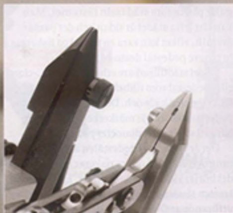
Olika placering av justerskruvar.