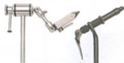
Rotation kontra klassiskt. Två grundmodeller av flugbindarstöd.

Det finns två grundmodeller av flugbindningsstöd. I den ena modellen, den klassiska, sitter chucken i en sned arm mot städaxeln. Här finns olika kombinationer där chuckaxeln och vinkeln på den är fast eller vridbar. En fördel med den klassiska modellen är att den överlag är ren från utstickande föremål och att man lätt kan komma åt detaljer baktill på flugan.