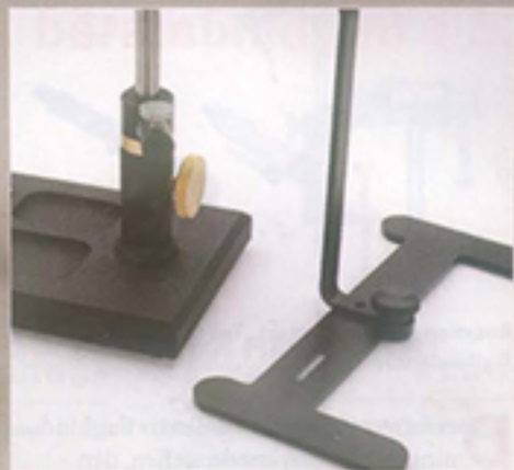
Olika tyngd, olika stadigt.