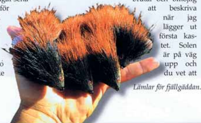
Lämlar för fjällgäddan.

Men tyvärr ställer solen och det spegelblanka vattnet till det för oss och fisket är inte helt på topp. Vädret gör dock att det känns som att fiska i ett akvarium. Vid vissa kast följer två, tre och ibland fyra stora gäddor flugan hela vägen in till båten. Vi kunde stå och jigga flugan